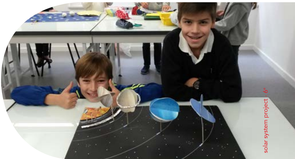
solar system project - 6 e