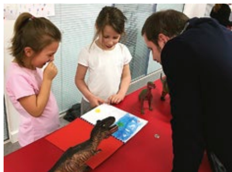
Year 1 pupils show off their Dinosaur Journals at the Jeannine Manuel Dinosaur Museum

Throughout their time at school, our students will learn to write in a range of formats , from experiment write-ups to complete novels. They will also learn how to approach the writing process in different ways, writing on their own at times, or with their peers at others. There will also be times when they will write